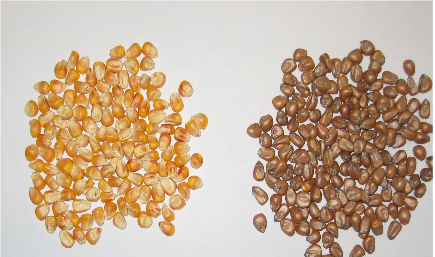
granos cobertos Floravit 2% en peso